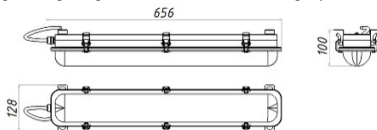
Рисунок 1 Светильник «L-sub 25»

1.5 Общий вид и габаритные размеры светильника показаны на рисунке 1.